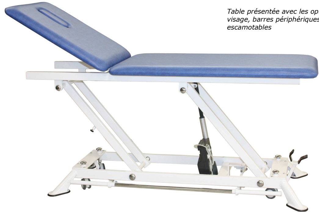
Table présentée avec les options trou visage, barres périphériques et roulettes escamotables