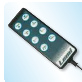
hand set control pulsantiera cod. SWC 23