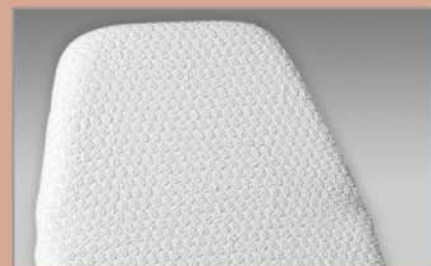
Copriletino Bed sponge cover