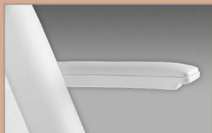
Coppia braccioli automatici Flat arm rest couple