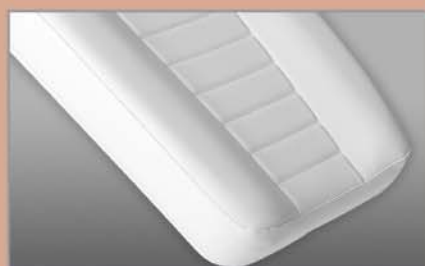
Materasso anatomico Anatomic mattress