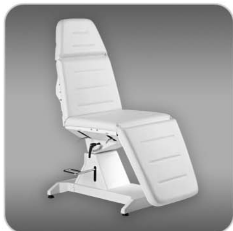
Cod.102 Versione standard / Standard version