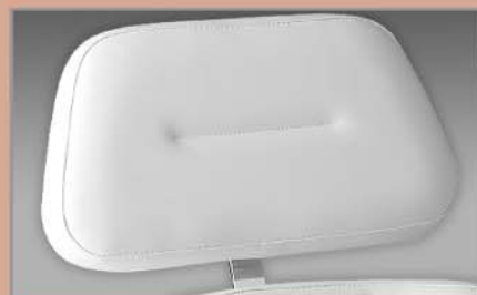
Testa Zak grande Big Zak head rest