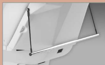
Portarotolo Roll holder