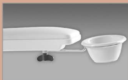
Coppia bacinelle manicure Manicure bowl couple