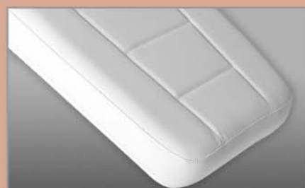
Materasso morbido Soft mattress