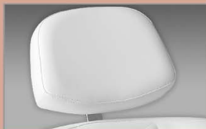
Testa Zak piccola Small Zak head rest